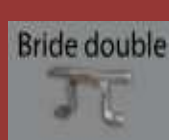
bride double 80 x 40