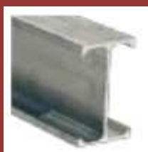
Support I ALU