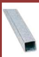
Support 40 x 27 x 2