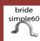
bride double 60