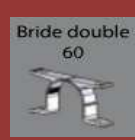
bride simple 60