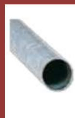
Support diam 60 x 2,9