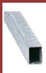
Support 40 x 40 x 2

1,50 m 2m 2,50 m 3 m 3,50 m 4 m 4,50 m 5 m