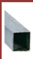
Support 80 x 80 x 3