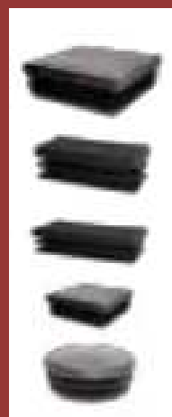
bouchons plastiques pour tube 80 x 80 bouchons plastiques pour tube 80 x 40 bouchons plastiques pour tube 40 x 27 bouchons plastiques pour tube 40 x 40 bouchons plastiques pour tube diam.60