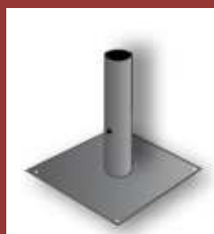
Fourreau platine Pour tube 80 x 80 Pour tube 80 x 40 Pour tube diam.60 kit 4 goujons + chevilles M12 x 120