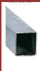
Support 80 x 80 x 2