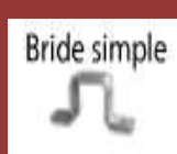
bride simple 80 x 40