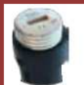
Bouchon en option