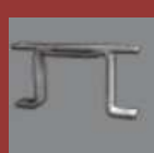
bride double 80 x 80