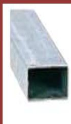
Support 80 x 40 x 2